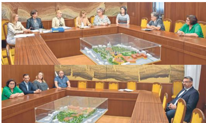
A Helyi Választási Bizottság május 6-ai ülésén nyilvántartásba is vette a Jobb Nagykőrösért civil jelöltjeit: